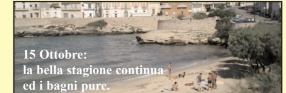
15 Ottobre: la bella stagione continua ed i bagni pure.

zio c'è, si è pronti a ricevere in qualsiasi momento, anche quando tutto sembra inutile. Questo significa dare un servizio ed essere un servizio pubblico. E significa anche, aver capito che bisogna ampliare quei miseri venti giorni di stagione turistica. Bisogna che tutti facciano la loro parte, il clima ci penserà a far la sua, come ha sempre fatto, da sempre, fino a Novembre.